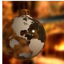
Cómo se celebra la Navidad en Estados Unidos