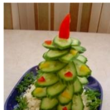
Cómo hacer un árbol de Navidad con pepino