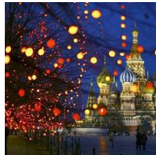
Cómo se celebra la Navidad en Rusia