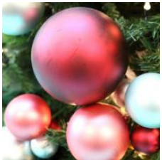
Cómo se celebra la navidad en China

Estos artículos también han gustado a otros usuarios