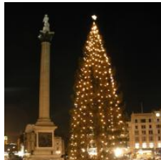
Cómo se celebra la Navidad en Inglaterra