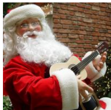
Cómo celebrar la navidad