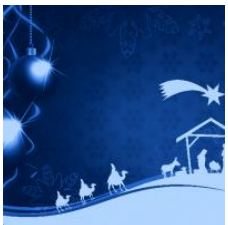
Cómo es la historia de la Navidad