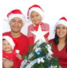
Cómo celebrar la navidad en familia

Si te ha interesado este artículo, échale un ojo a esto