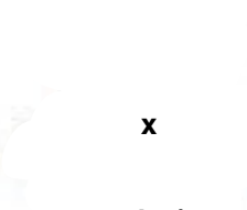
estar solo (en casa)