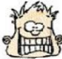
estar muy feliz