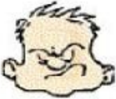
estar enojado (enfadado)