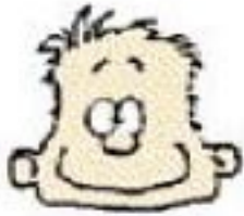
estar feliz / contento