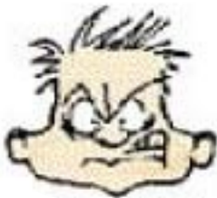
estar harta de...