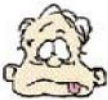
tener sueño estar cansado